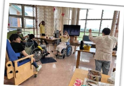
朝の会では、ラジオ体操や歌体操をして身体をほぐします。前に出て体操して下さる利用者様もいて元気いっぱいにぎやかです。

黒ひげ危機一髪ゲームで遊びます。順番にナイフを刺して飛び出した時にはみんながびっくり！大好きなゲームです。